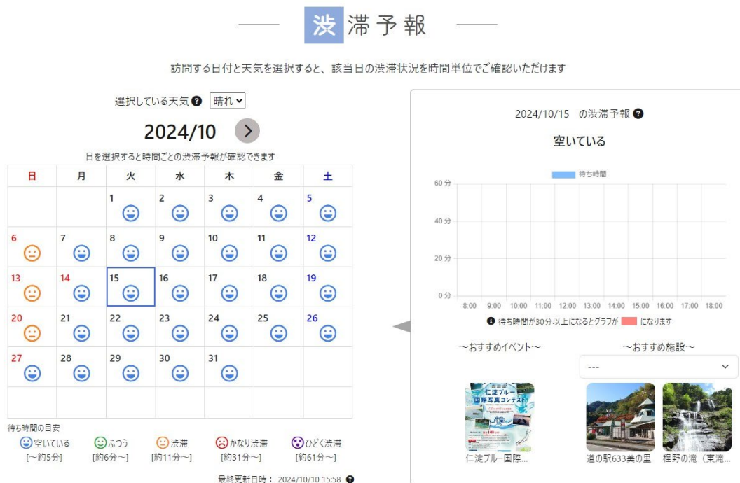
<渋滞予報サイトのイメージ>

渋滞予報サイトは 2024 年 10 月 21 日から同年 12 月 20 日まで公開されます。